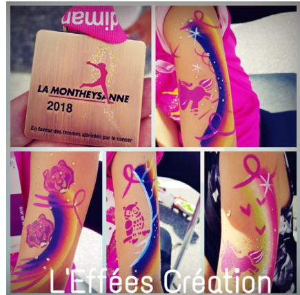
Schmink-Workshop während des Laufes «La Montheysanne», der am 26. August 2018 stattfand.

Im Rahmen des kantonalen Programms wurden in diesem Jahr 13'161 Mammographien durchgeführt, die Aktivitätsrate beträgt 59,80%.