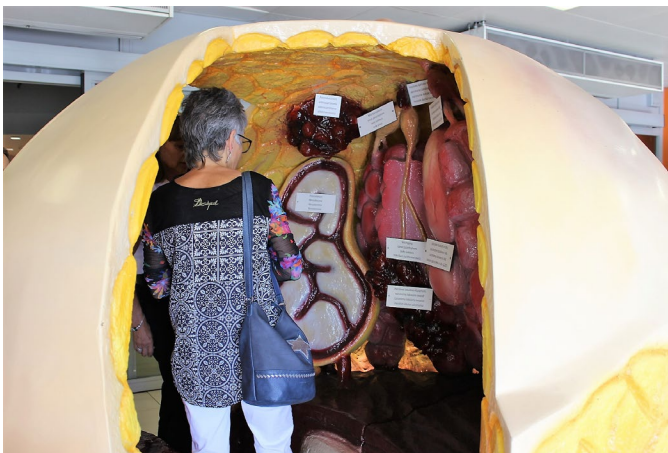
Interaktives Modell der Riesenbrust, ausgestellt vom 26. bis 29. November 2018 in der Migros Métropole in Sitten.